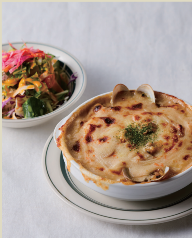
ドリアランチ ..... 1,400 Doria lunch (Baked rice gratin)