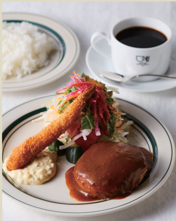
ハンバーグエビフライランチ ..... 1,500 Hamburg & fried shrimp lunch

エビ・イカ・タコ・アサリたっぷりの魚介を特製ホワイトソースに。 ライスの上のにせ焼き上げました。