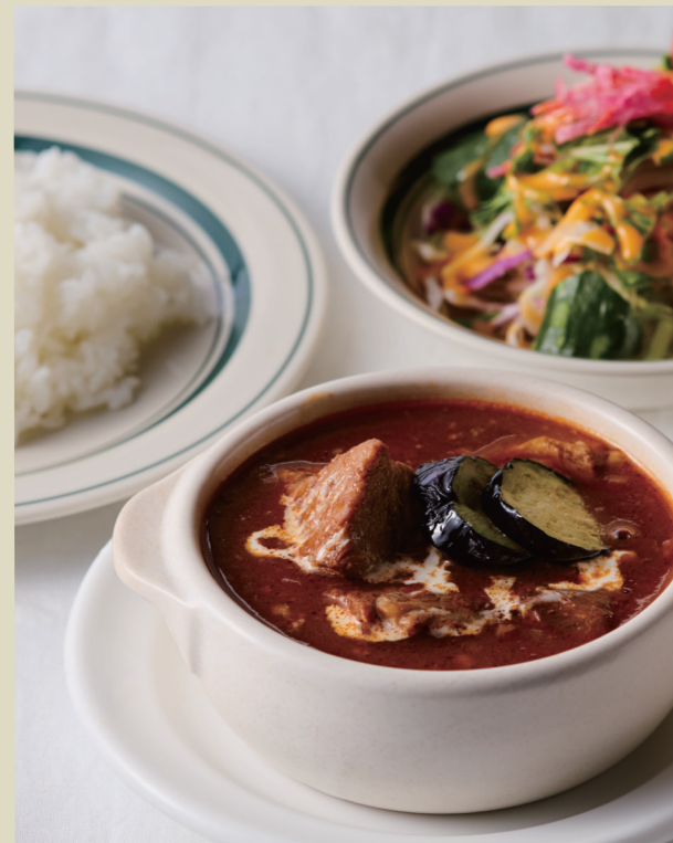
ビーフシチューランチ ..... 1,600 Beef stew lunch

ドルフの人気No.1ランチ。王道の洋食メニュー。 肉感たっぷりのハンバーグを特製デミグラスソースで。